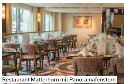
Restaurant Matterhorn mit Panoramafenstern