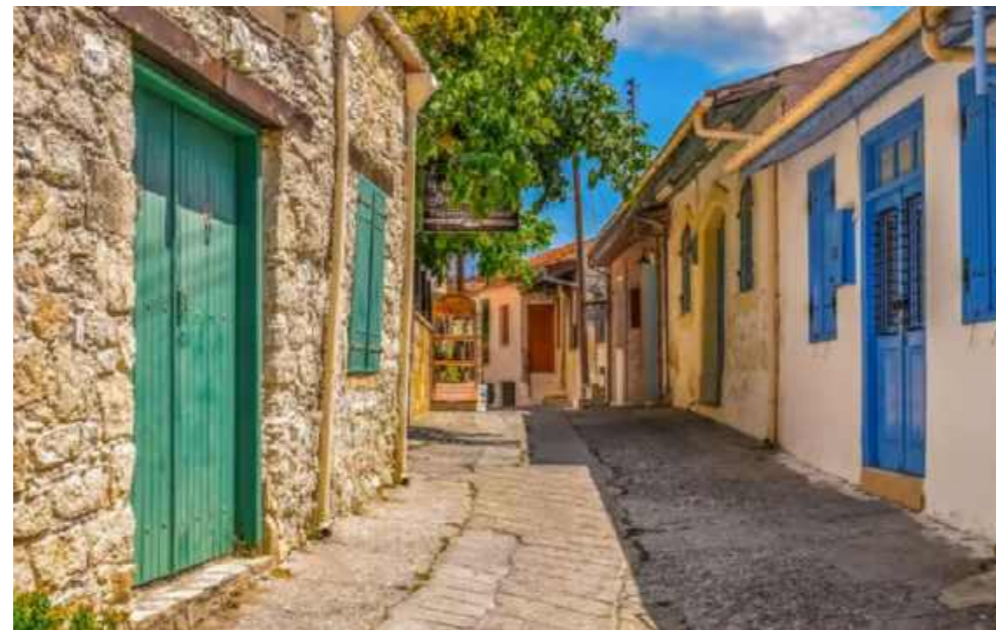
Zyperns Vielfalt: griechischer Tempel in Kato Paphos (vorherige Seite) | Diese Seite von oben: Saranda Kolones, Paphos | Salzsee bei Larnaka | Troodos-Dorf Omodos | Pool im Casale Panayiotis

Ferienorte wie Ayia Napa mit seinem Nissi Beach und gehobeneren Stränden wie Coral Bay in Paphos. Mehr als 50 Strände auf der Insel dürfen das Label Blaue Flagge der Stiftung für Umwelterziehung in Kopenhagen führen – es steht für Sauberkeit und Sicherheit. Zudem liegt die Insel an strategisch exponierter Lage im südöstlichen Mittelmeer an der Schnittstelle zwischen Europa, dem Nahen Osten und Nordafrika. Die mehr als 10.000 Jahre zurückreichende Geschichte wurde unter anderem von Ägypten, dem Alten Griechenland, den Römern, Byzanz, den Kreuzrittern, den Osmanen und schließlich den Briten dominiert. Eine Reihe antiker Stätten zeugen von der reichen Vergangenheit. Die Unesco hat drei von ihnen ins