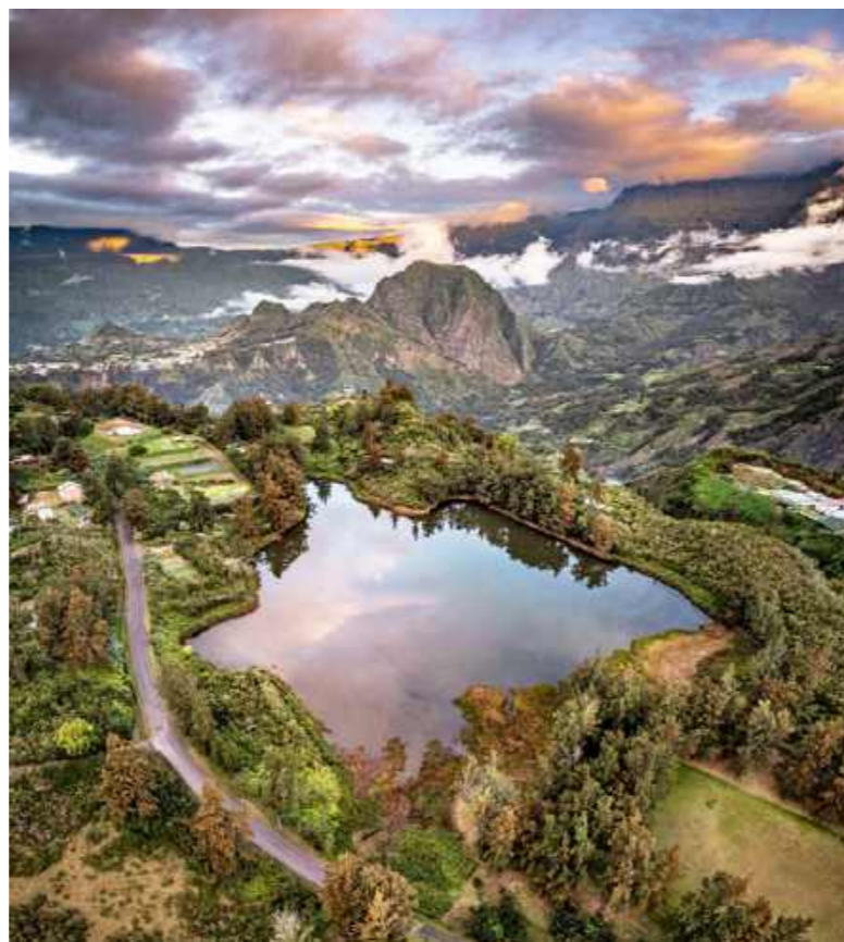
Rechts: Spektakuläre Natur zeigt sich überall. Die fruchtbare Täler umschliessenden Berge waren einst Zufluchtsorte der Sklaven. Heute sind sie Sehnsuchtsziele für Wanderer.

der sechsstündigen Wanderung bis zum Übernachtungsstopp sind 1700 Höhenmeter zu überwinden. In der Berghütte Caverne Dufour gibt es zur Stärkung das Nationalgericht «Cari poulet», ein scharfes Chili-Poulet-Curry – Vorsicht, Suchtgefahr! Die Nacht ist kurz, um 3 Uhr morgens brechen wir schlaftrunken zum Gipfel auf. Für die restlichen 600 Meter Anstieg brauchen wir 2,5 Stunden. Behutsam geht es Schritt für Schritt vorwärts. Und dann liegt mir die ganze Insel zu Füssen. Die Sonne bricht durch die Wolken, taucht die Szenerie in flammende Rot- und Purpurtöne und bringt meine Endorphine zum Hüpfen. Geschafft!