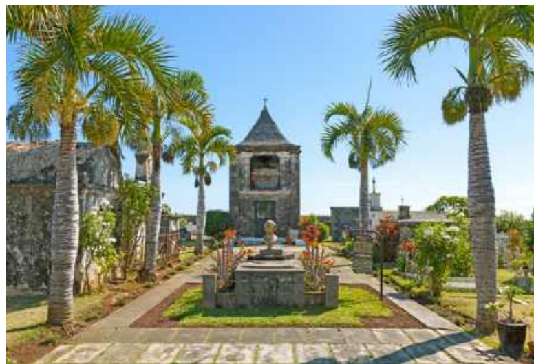
Oben: Auf dem Friedhof Saint-Pierre liegen viele Piraten begraben.