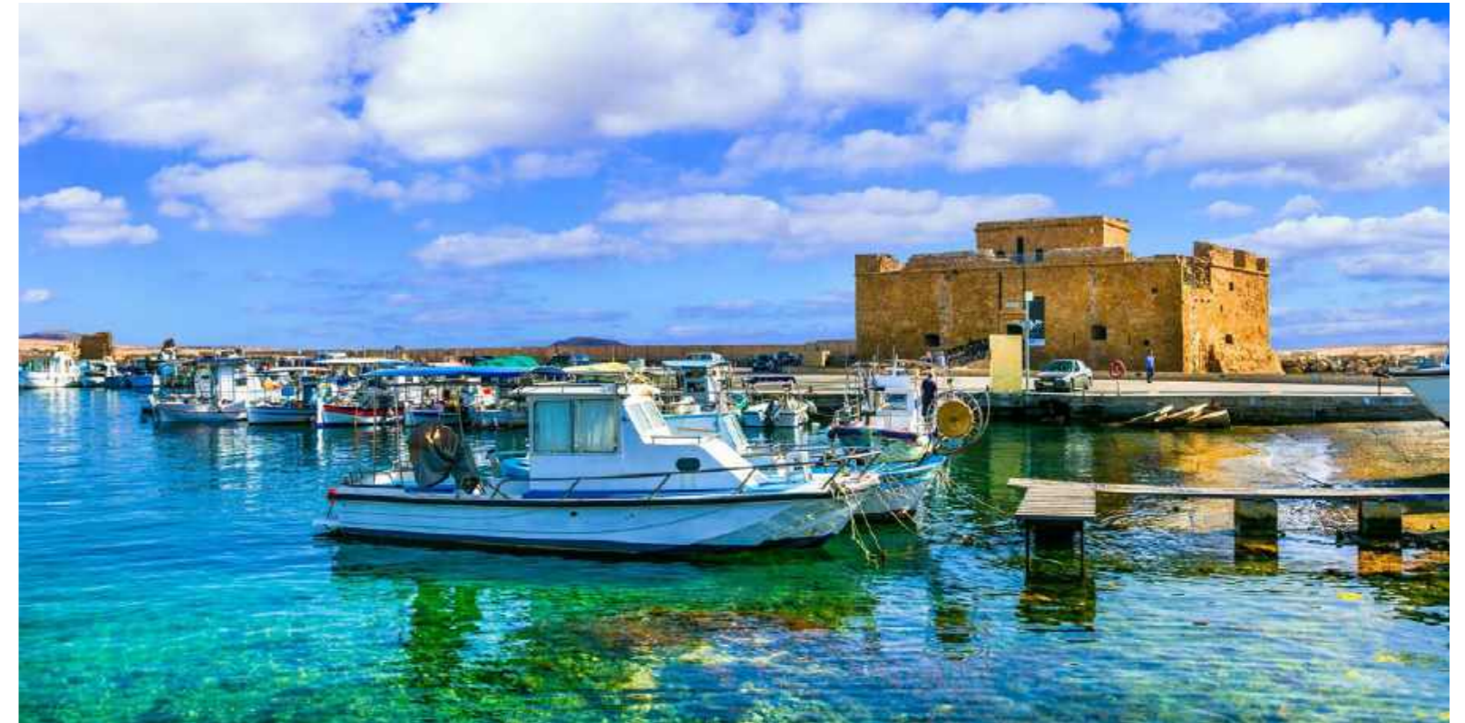
Eines der Wahrzeichen von Paphos, die Burg am Hafen, wurde im 14. Jahrhundert auf Ruinen aus dem 8. Jahrhundert gebaut.

Kirchen, Tavernen, Wasserfälle Und drittens, um wieder ins Troodos-Gebirge zurückzukehren, stehen zehn byzantinische Kirchen