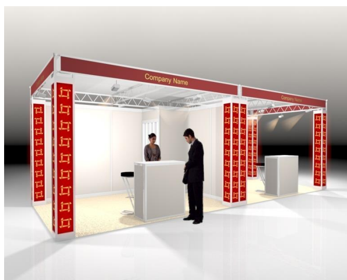
Beispiel: Asienstand 12m 2 mit 2 offenen Seiten

Die angegebenen Preise beziehen sich auf einen Stand mit einer offenen Seite. Für Standpakete mit mehreren offenen Seiten fallen die Zuschläge wie auf Seite 1 unter «Zuschlag – Stand mit mehreren offenen Seiten» beschrieben an.