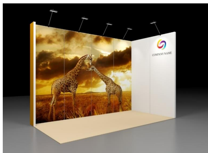
Beispiel: Emotionstand 8m 2 mit 2 offenen Seiten

Die angegebenen Preise beziehen sich auf einen Stand mit einer offenen Seite. Für Standpakete mit mehreren offenen Seiten fallen die Zuschläge wie auf Seite 1 unter «Zuschlag – Stand mit mehreren offenen Seiten» beschrieben an.